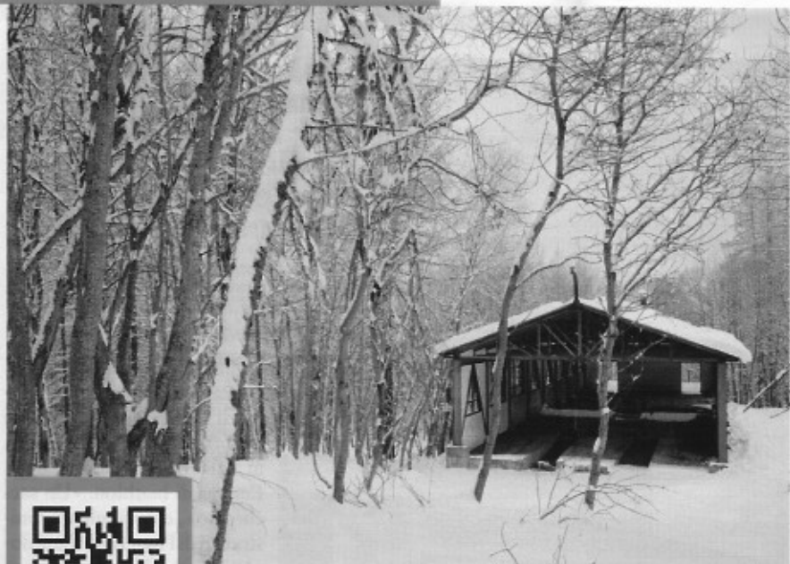
A Pian Gelassa (Torino) la stazione di partenza della seggiovia inaugurata nel 1969 e completamente abbandonata dopo una decina di anni