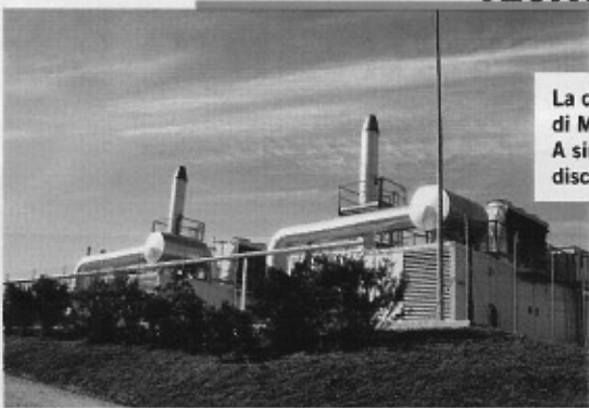
La centrale elettrica di Maiolati Spontini. A sinistra: la discarica di Pecci

Oggi in Italia esistono 28 impianti di digestione anaerobica per la produzione di biogas, concentrati principalmente tra Trentino, Piemonte, Veneto e Lombardia. Alcuni sono molto piccoli, in grado di lavorare appena poche centinaia di tonnellate. Ma complessivamente sono autorizzati a trattare (anche se in effetti lavorano un po' meno) circa 700 mila tonnellate di rifiuti organici l'anno. Per avere un ordine d'idea, secondo una ricerca condotta da Ernst & Young e commissionata dalla National Grid inglese, se i vari flussi dei rifiuti dell'intero Regno Unito fossero sfruttati per la produzione di biogas, la metà delle abitazioni dell'intera nazione potrebbe essere riscaldata in questo modo. Vengono in mente i sei milioni di ecoballe di Napoli, oltre sette milioni di tonnellate di rifiuti indifferenziati, pressati e accantonati nelle discariche. Facendo le debite proporzioni, il cor-