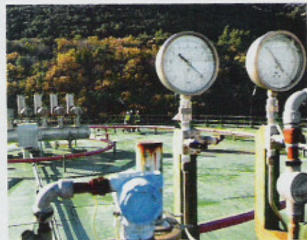
Tecnici sul tetto di un serbatoio controllano gli esplosivimetri, di cui a destra si vede un dettaglio. A sinistra: zona di trasformazione del gas, i quadri elettrici e, in basso, i serbatoi col gas liquido estratto dalla nave